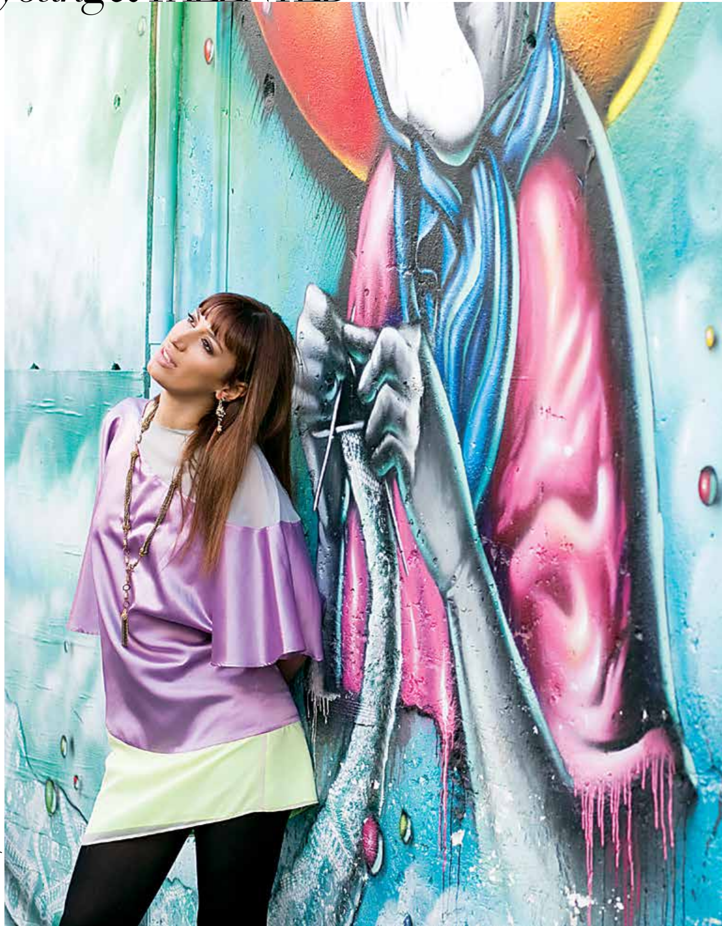
ΕΠΙΜΕΛΕΙΑ: Yasmine Mina